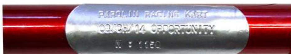
Foto della placchetta che evidenzia il n° di omologa, il nome del modello e il n° del telaio, la stessa dovrà essere fissata nella traversa posteriore B5 verso il centro del tubo stesso.